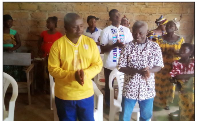
Le culte à l'église La Voie du Salut en Guinée