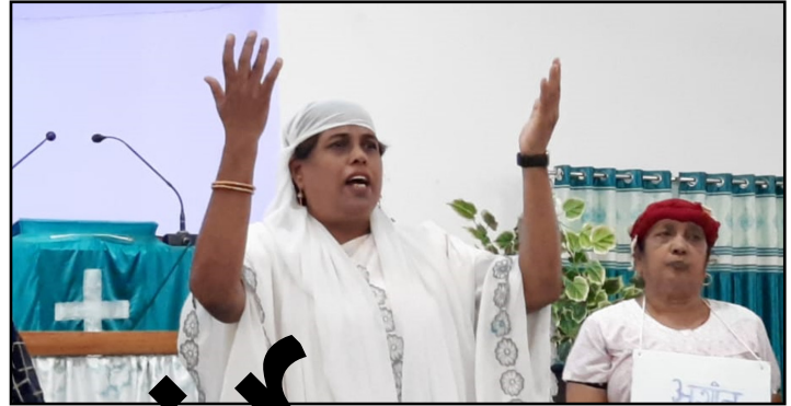
L'église Sunderland Mennonite Church, Dhamtari, India

Part of the issue – as my students at university hear often – is the tendency to not take the socio-political context or the literary context into consideration when reading and interpreting Scripture. The host of The 700 Club , for example, assumed the “you” in the “you are the salt of the earth... You are the light of the world...” to refer to him and/or American Christians as Americans.