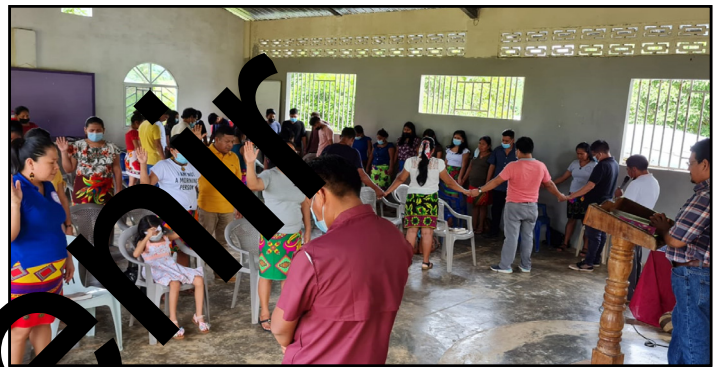
Iglesia Evangélica Unida Hermanos Menonitas de Panamá

There have been interpretations of the Sermon on the Mount that do not challenge power.