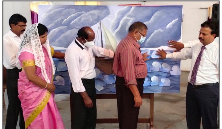
Les églises membres du monde entier ont célébré le Dimanche de la Paix 2021 en utilisant le matériel pour le culte de la Conférence mennonite mondiale intitulé « Trouver l'espoir et la guérison en temps de crise ».

Tu es le prince de la paix Tu es la Résurrection et la Vie. Tu es puissant pour sauver. Notre espoir et notre confiance est en toi. Amen